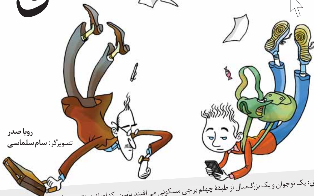
رویای صدر تصویرگر: سام سلماسی